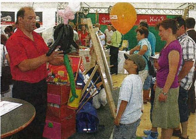
Auch für die kleinen Besucher war jede Menge geboten.

Weitere Fotos im Internet unter www.vilstalbote.de .