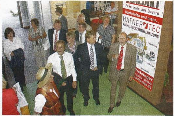
Beim Rundgang über das Messegelände konnten sich die Ehrengäste einen Überblick über das abwechslungsreiche und informative Ausstellungsangebot verschaffen.